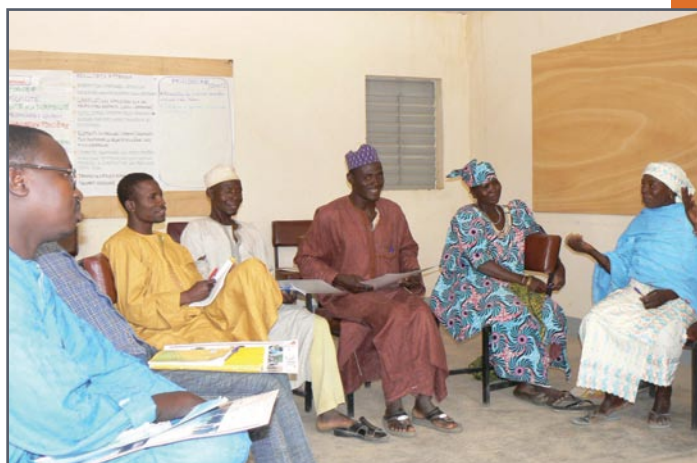
Atelier de Takiéta pour des outils genre Niger 2007

1. Etude : Genre et décentralisation au Sénégal.