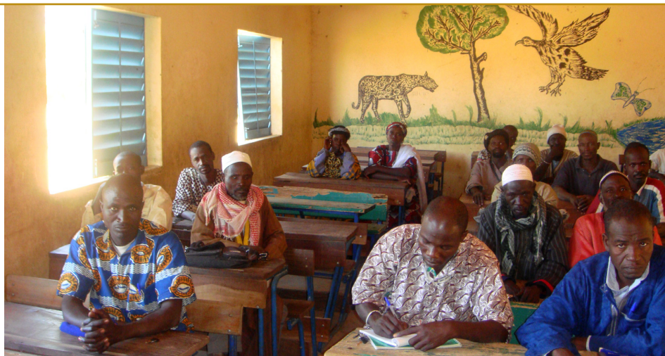
Une réunion de la coopérative agricole de Timissa.