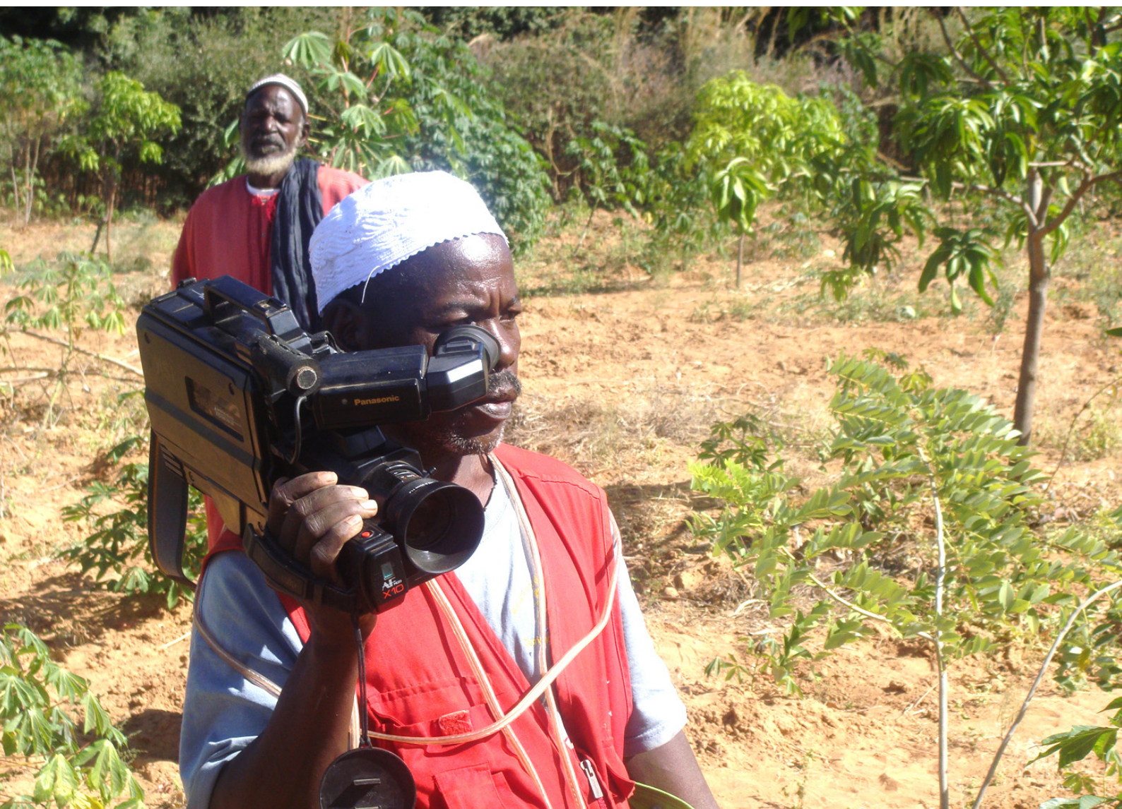
un animateur de la radio communautaire de Timissa en train de filmer les réalisations de la coopérative Sininyesigiton de Timissa .

Toutes les 24 émissions radio de sensibilisation sur les changements climatiques prévues dans le projet, ont été réalisées par les animateurs. Un micro trottoir sera réalisé afin de mieux jauger les appréciations des auditeurs. Des reportages ont été menés dans les villages de Ndawène Saraniama, Koumbidia Socé, Yetty Khaye, Maka Yop, Médina Saly, Same Pathé Willane où les populations pratiquent le maraîchage, l'embouche bovine, l'apiculture comme moyens de réduction de la pauvreté. Ces expériences et les émissions ont été diffusées à la radio et enregistrées sous forme de CD audio et vidéo. De telles activités permettent aux communautés concernées de faire face aux déficits de revenus agricoles engendrés en partie par les fluctuations pluviométriques. Les reportages peuvent ouvrir aux populations des perspectives de collaboration avec d'autres partenaires pour continuer à développer ces activités qui réduisent leur vulnérabilité à la pauvreté et renforcent leurs capacités d'adaptation aux variations climatiques.