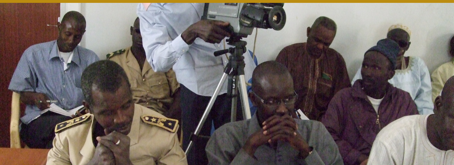
Journée de lancement du système d'alerte précoce contre les feux de brousse à Koungheul.

A Timissa, pour lutter contre le bradage des récoltes, la coopérative a instauré un système de warrantage. Il consiste en la mise en place d'une ligne de crédit sur fonds propre pour faire face aux besoins financiers des membres de la coopérative. Par exemple si un producteur veut brader 5 sacs de mil pour un besoin de 20 000 F, la coopérative lui donne 20 000F et garde le mil. A l'approche de la période de soudure, la coopérative vend le mil à un prix beaucoup plus intéressant, retire ses 20 000F et les frais liés à la conservation du produit. Le reste des ressources financières est reversé au producteur. La coopérative peut aussi, sur la demande du producteur lui vendre le mil à un prix inférieur à celui du marché tout en réalisant une marge de bénéfice. Cette pratique qui est réapparue avec les conséquences de la variabilité climatique, constitue un véritable mécanisme de protection et de solidarité. Cette pratique permet à la coopérative d'avoir plus de ressources financières et de répondre aux besoins de renforcement de la capacité d'adaptation de ses membres à une échelle plus grande. La démarche mérite d'être partagée au sein des OP bénéficiaires du FSSA.