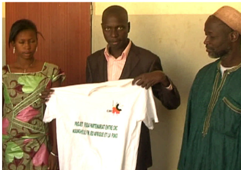
Un élève recevant son cadeau lors d'une émission radio jeux concours sur les changements climatiques à Koungheul

La capitalisation constitue un axe majeur dans le cadre du FSSA et permet de décrire les expériences endogènes d'adaptation aux changements climatiques et de les analyser afin d'identifier les facteurs de succès, les limites, les incidences et les conditions de reproductibilité et de mise à l'échelle pour une meilleure valorisation.