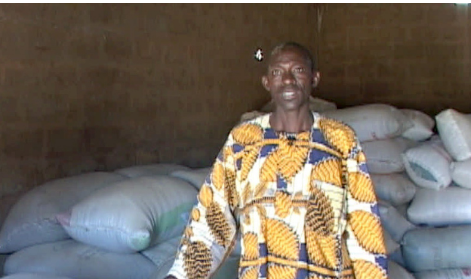
Magasin de stockage de semences améliorées de Timissa .Photo : Boubacar Sow

La compilation de toutes les émissions et reportages dans des CD audio et vidéo illustre le niveau d'organisation des responsables de la radio dans la gestion de leur projet.